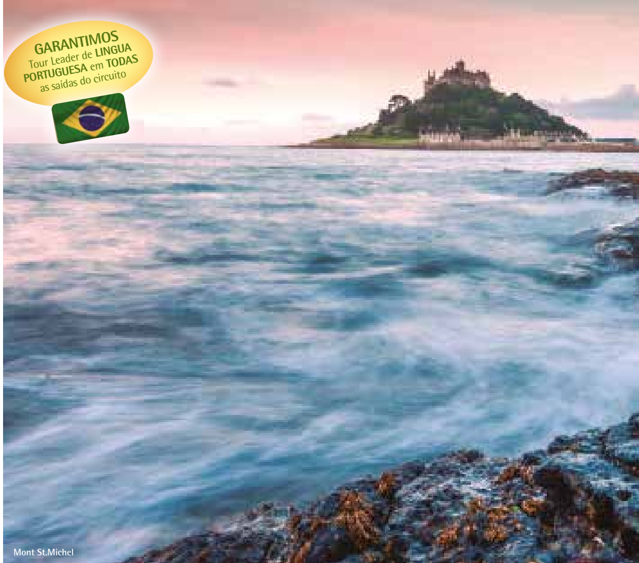
Mont St. Michel