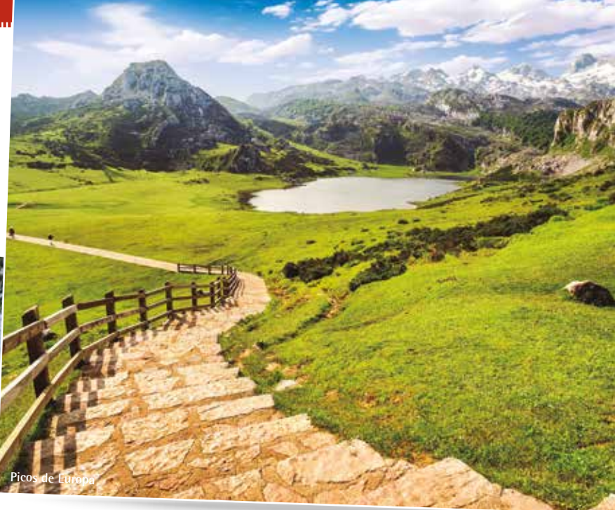
Picos de Europa