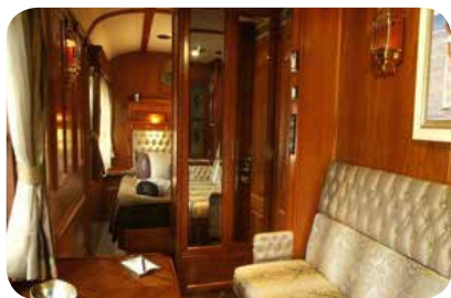
SUITE GRAN LUJO

Un tren que evoca la nostalgia y encanto de aquellos grandes expresos de principios del siglo XX, inspiración de memorables obras de la literatura y el cine, pero que a la vez dispone de las prestaciones de confort más avanzadas del siglo XXI. Gastronomía, paisaje, cultura, glamour, diversión y relax se unen para hacer de este viaje una experiencia única e inolvidable. Quien sube a bordo de El Transcantábrico realiza una travesía en el tiempo hasta los años 20 del siglo pasado, cuando circularon por primera vez los históricos coches Pullman, que hoy son sus salones.