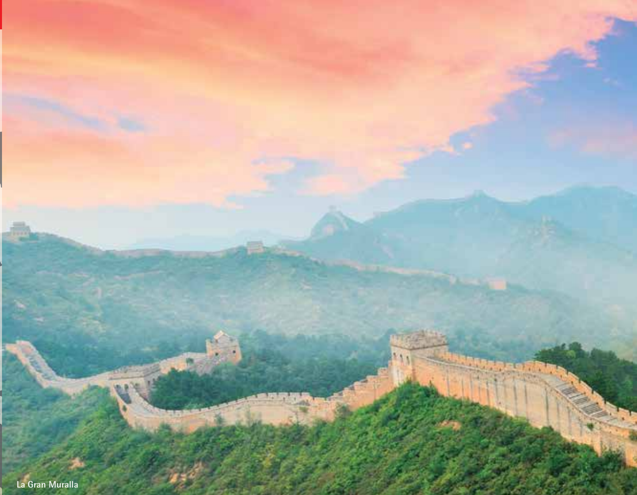
La Gran Muralla