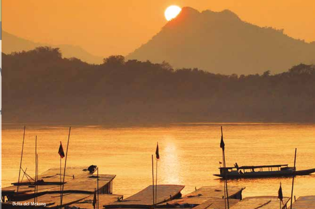
Delta del Mekong