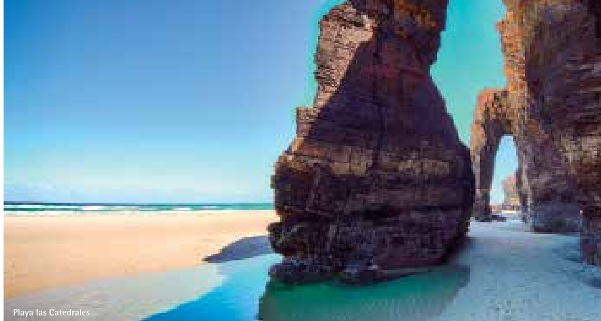
Playa las Catedrales