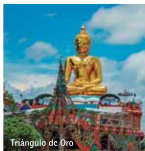
Triángulo de Oro