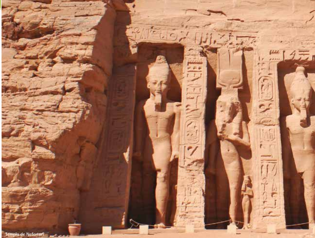
Templo de Nefertari