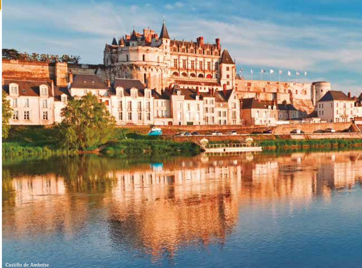
Castillo de Amboise

Consulte posibles cambios de hoteles en página 316 de este folleto.