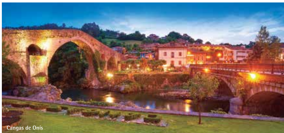
Cangas de Onís

Desayuno. Salida hacia Santander, y tiempo libre para recorrer algunos de los lugares de interés como son los Jardines de Pereda, Plaza Porticada, Plaza del Ayuntamiento y las calles de la parte antigua. Continuamos hasta Comillas, famosa por su Universidad y donde podremos ver la fantástica obra el Capricho de Gaudí. Seguiremos hasta Santillana del Mar, bella localidad, donde tan sólo es posible su visita a pie. Al pasear por la Plaza Mayor y las calles que parten de ella, descubrirá el encanto de este pueblo cántabro, en sus adoquines, en sus momentos, y hasta en las casas construidas hace siglos, con preciosas flores colgando de sus balcones. Alojamiento.