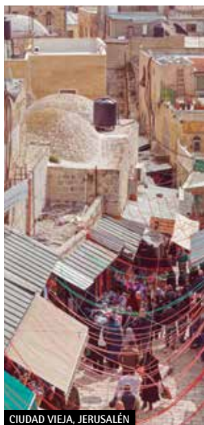
CIUDAD VIEJA, JERUSALÉN

Aplicable también a salidas en Martes, Miércoles, Jueves y Domingos (con cambio de itinerario).