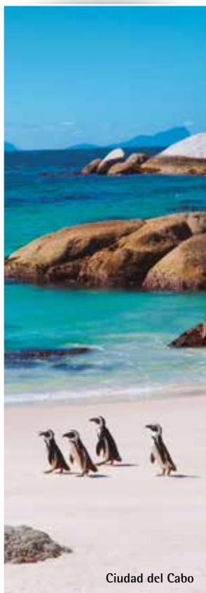
Ciudad del Cabo

Lunes y Viernes Del 01/Ene al 31/Dic/2018