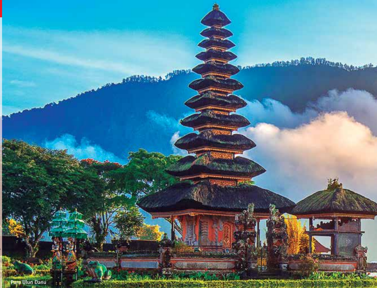
Pura Ulun Danu