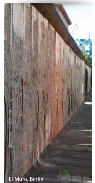
El Muro. Berlín